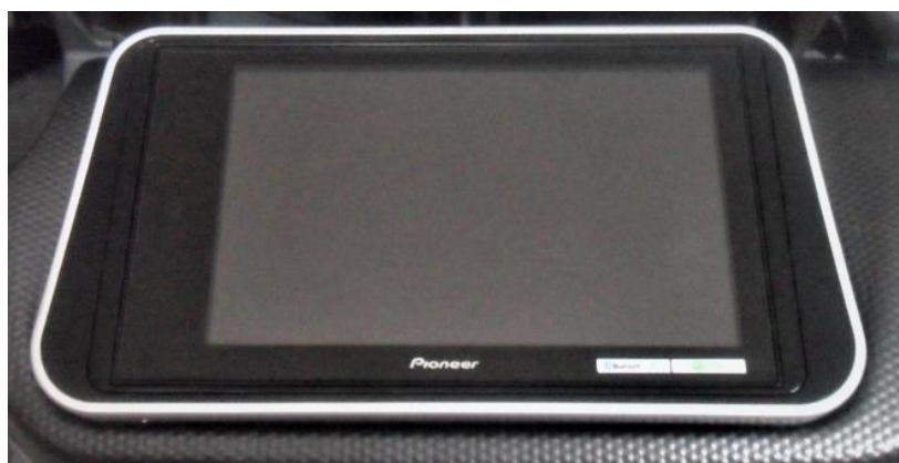
MOLDURA Nissan Kicks 8" padrão Pioneer

Passo 7: Efetuar as conexões, encaixar a moldura no suporte.