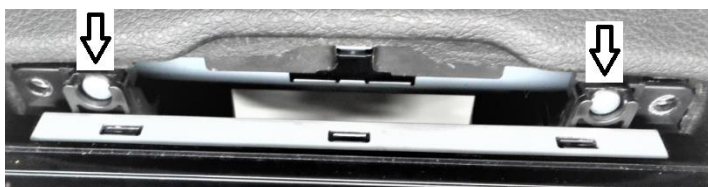
Fixação tela lado superior.

Passo 4: Conectar os cabos, colocar a tela, alinhando os suportes, fixar a parte superior e inferior com os parafusos autofixantes.