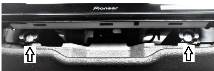
Fixação tela lado inferior.