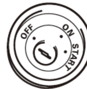
Sem posição ACC