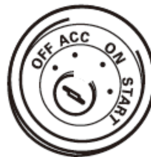
Com posição ACC